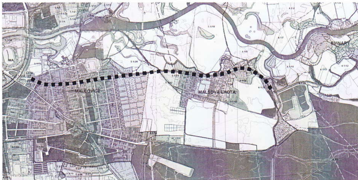
obr.: výřez z výkresu funkčního využití území platného ÚPmHK s orientačním vyznačením řešené lokality

Podle platného Územního plánu města Hradec Králové (ÚPmHK) a předložených podkladů je navrhovaný záměr - akce „Silnice III/29827 Malšova Lhota – Hradec Králové“ a „Rekonstrukce chodníků a infrastruktury silnice III/29827 Malšova Lhota – Hradec Králové“ z hlediska funkčního využití území situován do plochy „plochy pro motorovou dopravu – komunikační síť“ – tj. do plochy zajišťující v území zejména dopravní funkci. Částečně (okrajově) pak může zasahovat i do ploch obytné zástavby, veřejné zeleně, luk a pastvin. (viz. obr.).